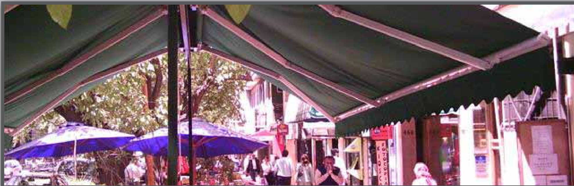
Las imágenes de producto son de carácter ilustrativo.