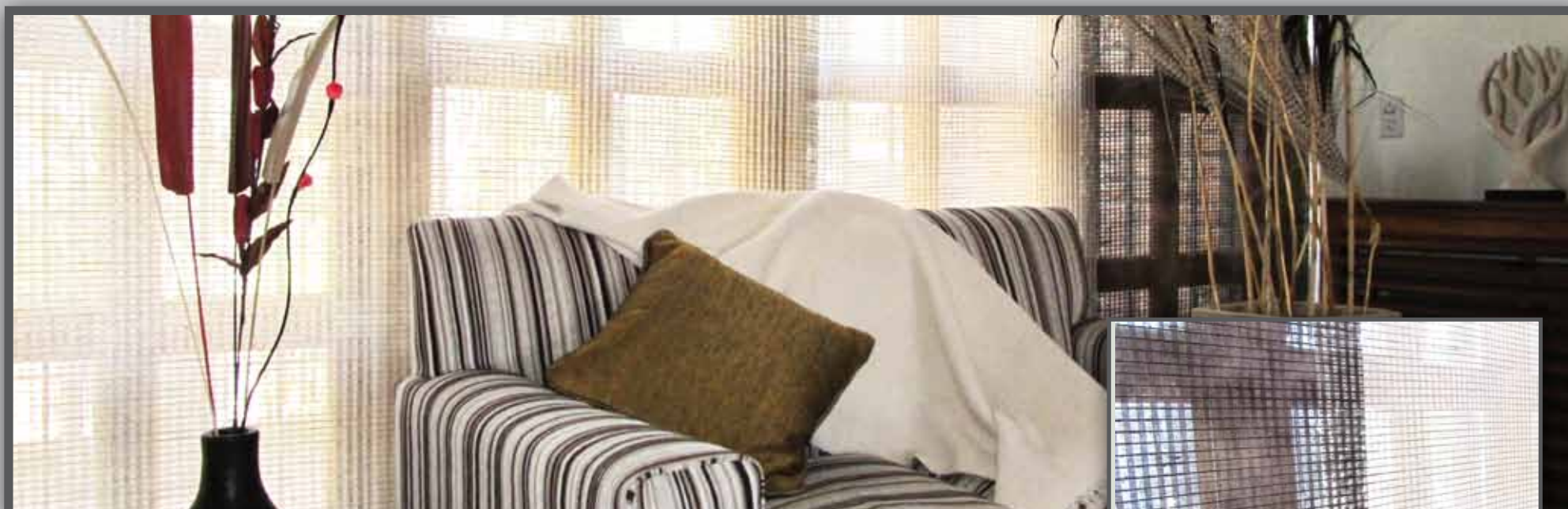
Las imágenes de producto son de carácter ilustrativo.